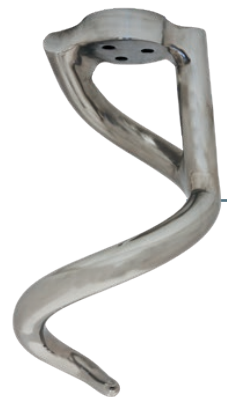
STANDARD TOOL UTENSILE STANDARD